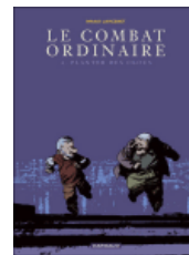
Combat Ordinaire, Larcenet