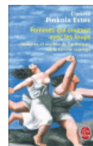
Femmes qui courent avec les loups