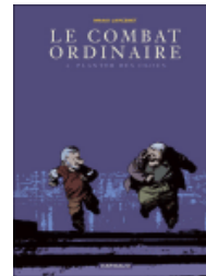
Combat Ordinaire, Larcenet